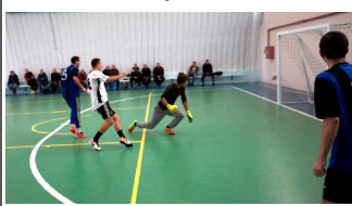
но было видеть.

Убедительную яркую и ... мужскую победу одержали заводчане на кубке города по футзалу. Да, именно мужскую. И это особенно приятно